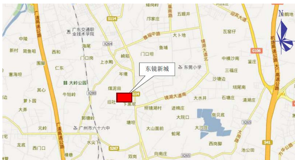
图 1.1-1 项目区地理位置图

自由人花园四期位于广东省广州市花都区新华街东镜村，新华街南 4km 处，东靠广花公路，南面为镜湖大道，交通便利。项目区地理位置见图 1.1-1。